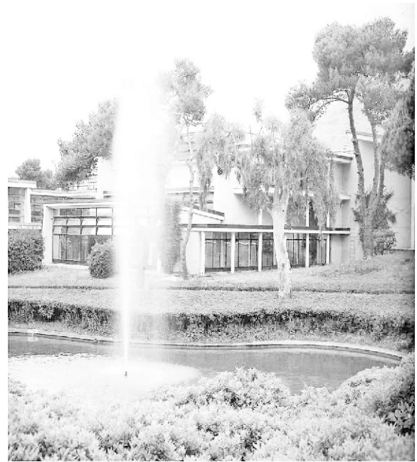
Figura 4. La laguna central de la planta Olivetti

y el parque, en cada piso se construyen maceteros colgantes. Adopta árboles caducifolios en los frentes soleados y las variedades usadas no pertenecen a la flora local, pero sí a la vegetación mediterránea. Esto demuestra su gran capacidad de intuir el formase de un microclima particular entre los edificios que permitiera un adecuado crecimiento.