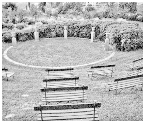
Figura 8. Anfiteatro de Villa La Apparita

paisajista seguía una metodología de trabajo rígida que le permitía estudiar cada caso antes de realizar sus proyectos. Estudiaba la estructura del paisaje y reflexionaba atentamente sobre el tipo de operaciones necesarias para realizar el proyecto.