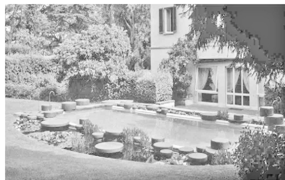
Figura 6. Villa La Terrazza

En este jardín, el círculo se vuelve rueda: 87 ruedas de piedra alrededor de una piscina de forma