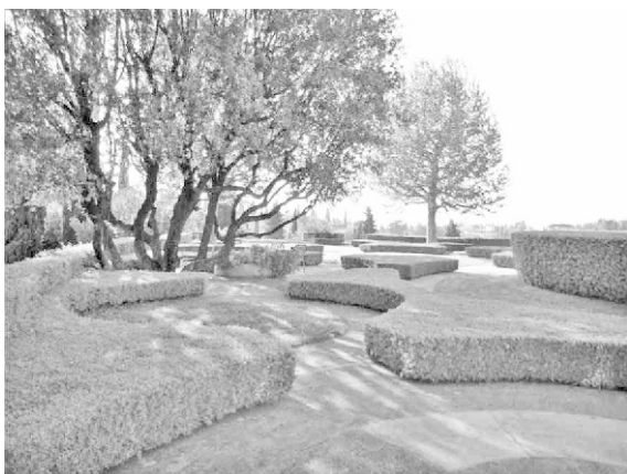
Figura 7. Villa Il Roseto

La villa del siglo XVI, por un lado limita con la calle, la fachada principal es de tres niveles. Él transforma la relación espacial de la villa con el exterior, creando un jardín colgante panorámico que permite establecer una relación directa de la