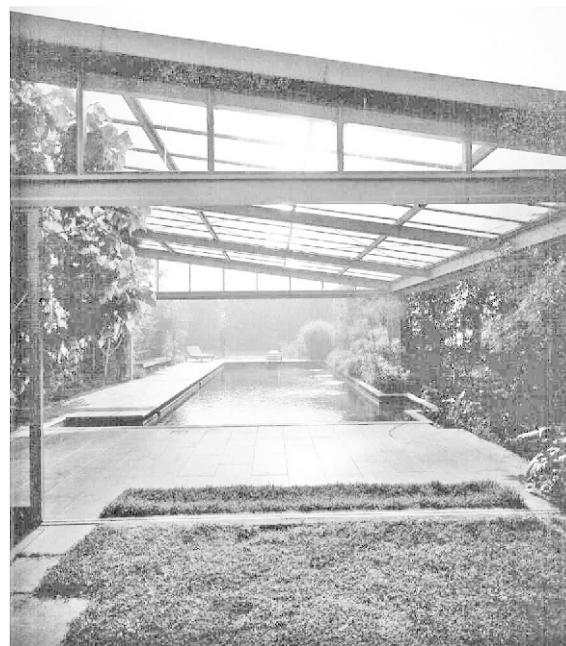
Figura 9. Piscina de Villa Il Castelluccio

El entorno de la habitación se vuelve un perfecto parque, con recorridos peatonales, piscina y campo