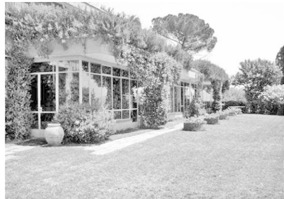
Figura 2. Los invernaderos de Villa Rondinelli

El jardín del invernadero inferior está delimitado en el paisaje por un cerco vivo de Viburno