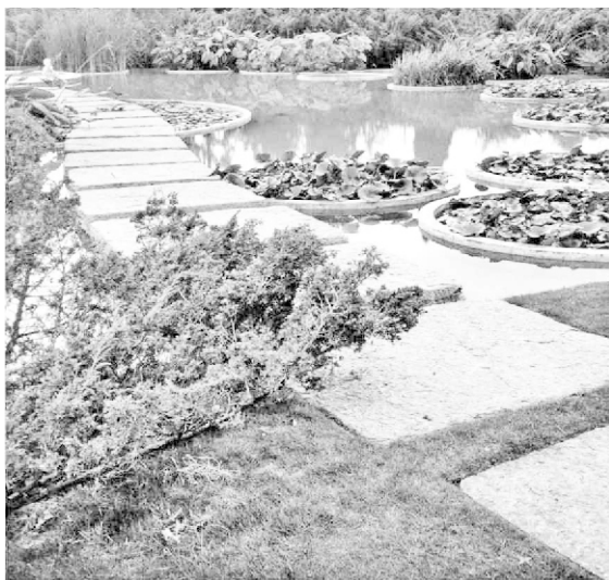
Figura 5. Villa Fiorita

Para ocultar el límite de la propiedad y dilatar el espacio, realiza ondulaciones en el terreno, trasplantando hacia el borde algunos de los árboles