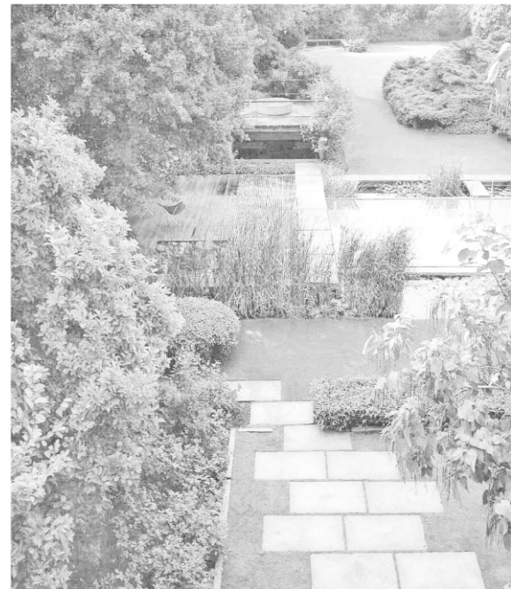
Figura 10. Jardín Theobald

Esto lo sabemos no sólo por las fotos que quedan del proyecto final, sino también por la cantidad de correspondencia localizada en el archivo.