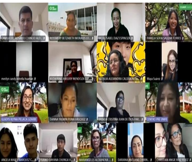
Padres de Familia 2022.1