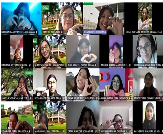
Estudiantes del Ciclo Académico 2022.1

Este año, estas reuniones se dieron de manera satisfactoria, por ejemplo, con el Ciclo Regular y Especial 2022-2, se tuvo una de las últimas reuniones el día miércoles 07 de diciembre, a las 7:00 p.m., para brindarles todas las indicaciones en relación a su Prueba de Aptitud, la cual se llevó a cabo el martes 13 de diciembre, y con ello se definió la cantidad de ingresantes a la Universidad a través de la modalidad del Centro Pre.