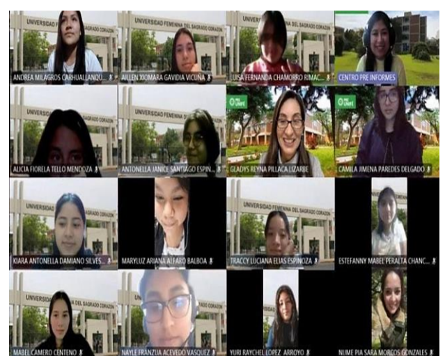
Estudiantes del Ciclo Académico 2022.2