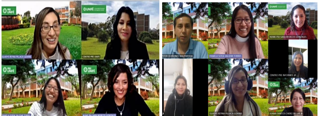
Reuniones de Coordinación con el Equipo Centro Pre 2022.2.

En el presente año, estas reuniones se llevaron a cabo de manera exitosa y se cumplieron con los objetivos propuestos: se logró el ingreso directo del 99.9% de matriculadas con muy buenos puntajes.