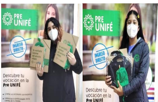
Alumnas ganadoras de premios